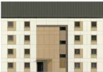
Przykładowa elewacja frontowa budynek A (wersja 2)

WARIANT 2 - Elewacja frontowa 1. Płaski balkon - w kolorze ciemnym 2. Płaski balkon - w kolorze jasnym 3. Balkon - balkon w kolorze jasnym 4. Balkon - balkon w kolorze ciemnym