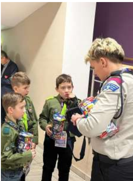
Wolontariusze z Hufca ZHP Ziemi Raciborskiej im. Alojzego Wilka w Kuźni Raciborskiej