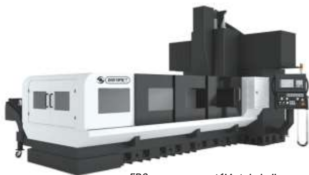
FBC – przesuwany stół i stała belka