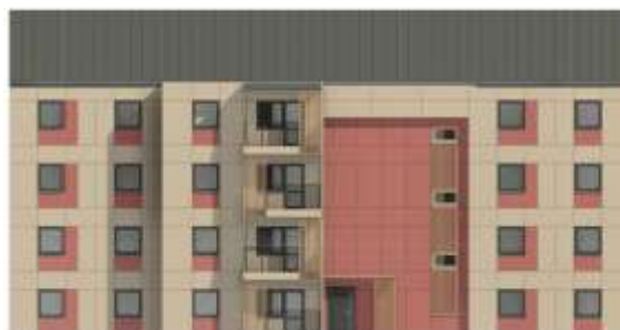
Przykładowa elewacja frontowa budynek B (wersja 2)

WARIANT 2 - Elewacja frontowa 1. Płaski balkon - w kolorze ciemnym 2. Płaski balkon - w kolorze jasnym 3. Balkon - balkon w kolorze jasnym 4. Balkon - balkon w kolorze ciemnym